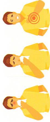
咳起来有痰 呼吸困难或喘息

病人需要注意的是有时候症状会突然恶化或 急性加重 。这些情况可能跟支气管感染和发炎有关。